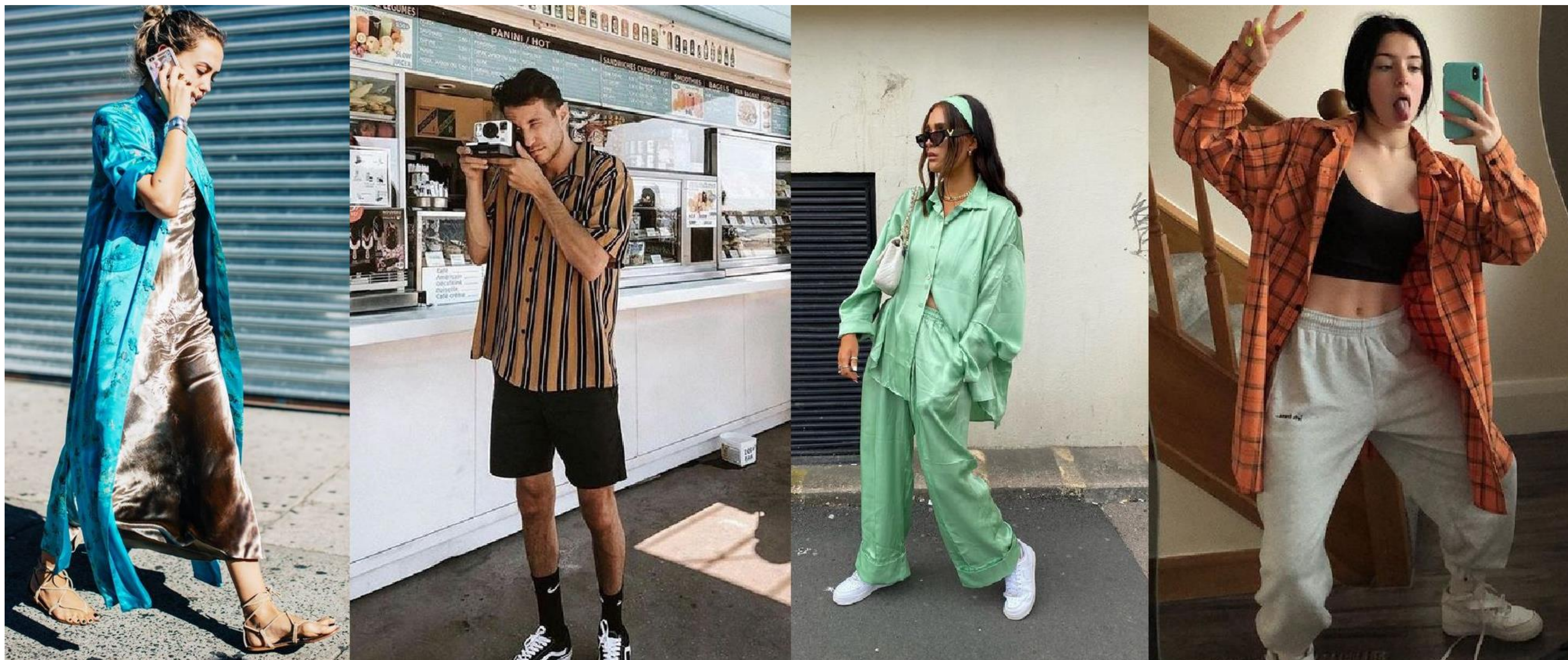
ДОМАШНИЙ ОДЯГ НА ВУЛИЦІ HOME CLOTHES OUTDOORS