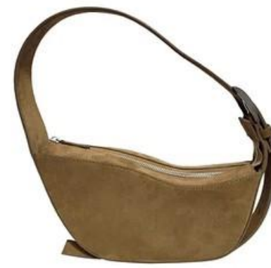
SAND SUEDE WAVE BAG 6 250,00€