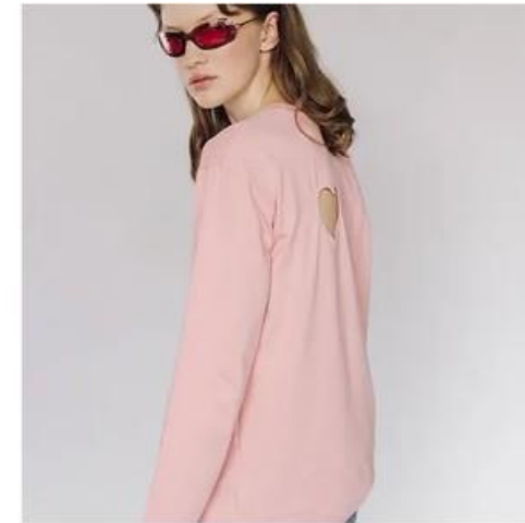
STRAWBERRY CREAM HEART LONGSLEEVE 1 180,00€