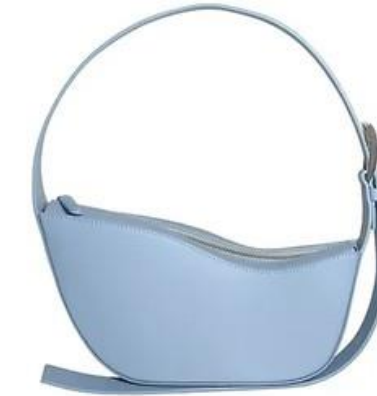
SKY BLUE WAVE BAG 6 250,00€