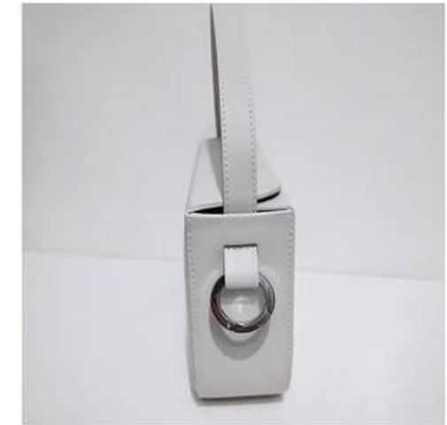
WHITE SUM BAG S Немає в наявності

KOZHUHAR - український бренд модних шкіряних аксесуарів та одягу, який вміло експериментує з формою та кольором. Кожного сезону з'являються особливі вироби для натхнення. Всі вироби елегантні у своїй простоті, але в той же час впадають у вічі і привертають увагу.